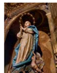
CATEDRAL DE SIGÜENZA (Templo parroquial de San Pedro)

Durante los días 17 y 18 de noviembre las delegaciones de juventud y vocaciones han realizado en Molina de Aragón la primera de las convivencias para adolescentes marcada por el calendario. Bajo el título "Atrevi-2" los más de 60 participantes han descubierto la llamada del Señor a la santidad y la necesidad de ser atrevidos para llegar a ella ■