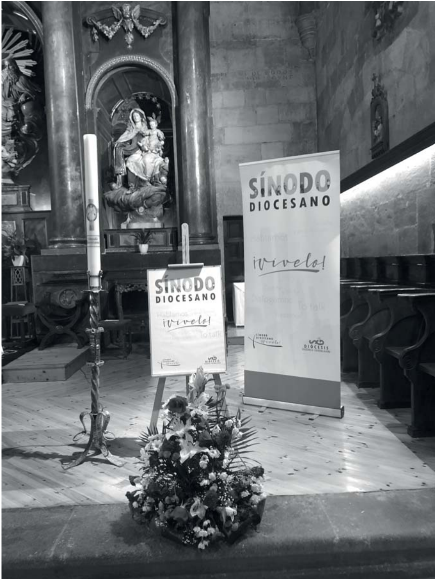
El Sínodo diocesano vuelve a protagonizar el nuevo curso pastoral 2022-2023, recién comenzado.